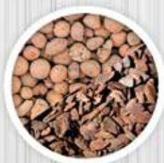
Argila Expandida e Casca de Pinus