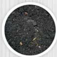
Terra vegetal e Substratos