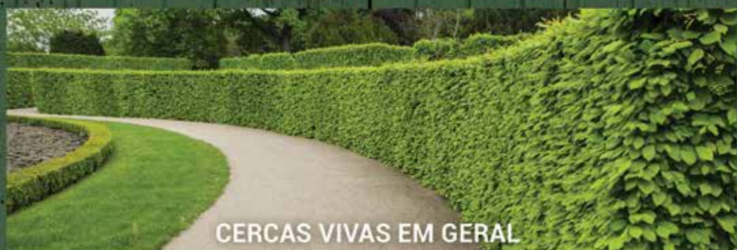
CERCAS VIVAS EM GERAL

TEL.(19) 3746-1954 CEL. (13) 99702-6928 BOX.: S-13 / S-14 / S-15 / R-24 CEASA - CAMPINAS /SP