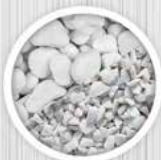
Pedra Branca e Pedrisco