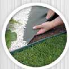
Manta e Limitador